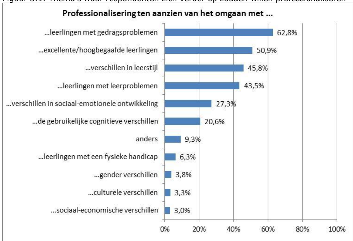
Figuur 3.1: Thema's waar respondenten zich verder op zouden willen professionaliseren

Bij de antwoordcategorie "anders" noemen respondenten met name opleidingen om specifieke vaardigheden voor het omgaan met verschillen in de klas te verbeteren. Enkele voorbeelden zijn: effectief de tijd verdelen over alle leerlingen, goede instructie geven op verschillende niveaus, goed toepassen van coöperatief leren, hoe meer tijd en ruimte vrij te maken voor individuele leerlingen, klassenmanagement, gebruik van ICT in de klas, omgaan met grote groepen, werken met meerdere niveaugroepen, het managen van de verschillende problemen binnen de klas, hoe op een snelle en eenvoudige wijze groeps- en handelingsplannen op te stellen, spelontwikkeling bij jonge kinderen en omgaan met externe druk. Daarnaast wordt ook professionalisering ten aanzien van specifieke groepen leerlingen genoemd, zoals omgaan met leerlingen in het autistisch spectrum, leerlingen die geen intrinsieke motivatie hebben, leerlingen met meervoudige intelligentie en leerlingen met hechtingstoornissen.