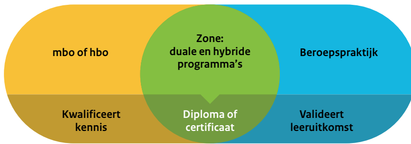
figuur 3. Vrije zone tussen het economisch domein en de beroepspraktijk

en zorg. Voor studenten wordt het studieaanbod meer relevant en ontstaan natuurlijk doorlopende leerlijnen binnen diverse domeinen op de arbeidsmarkt.