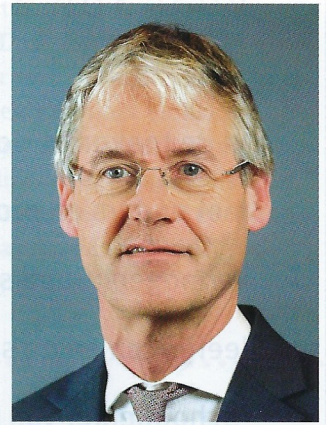
Arie Slob , demissionair minister van OCW: “De toekomstagenda schetst een concrete ambitie die richtinggevend kan zijn bij de doorontwikkeling van het vak van schoolleider en die inspiratie biedt.”

Het rapport ‘Schoolleiders over de Toekomst – Toekomstagenda schoolleiders primair onderwijs 2021-2025’ is te vinden op www.avsnl